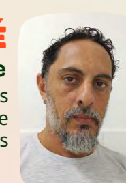
MAJÉ 4º Suplente Bombinhas Grande Florianópolis