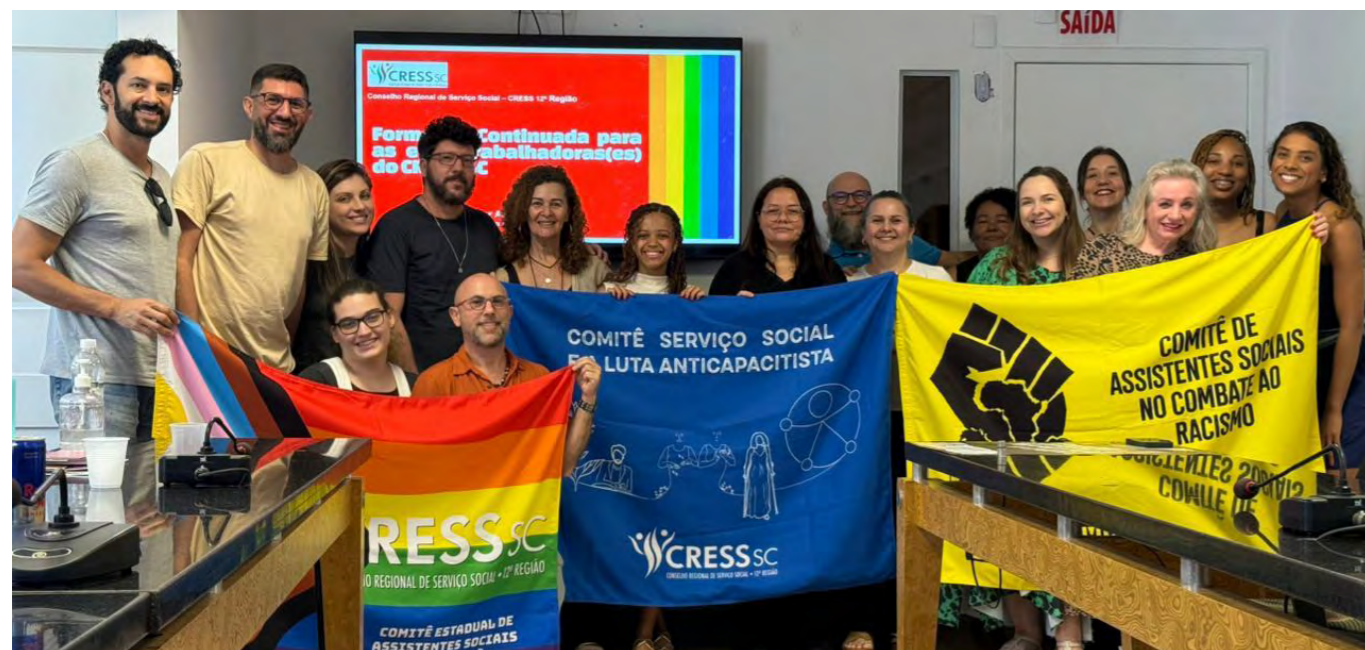
Parte da gestão "Coragem na Luta, Ética no Olhar: Esperançar e não Recuar" com trabalhadoras e trabalhadores do CRESS SC

Ao encerrarmos o triênio 2023–2026, a gestão “Coragem na Luta, Ética no Olhar: Esperançar e não Recuar”, do CRESS 12ª Região, dirige-se à categoria de Assistentes Sociais com o compromisso de compartilhar uma síntese do percurso construído coletivamente, marcado por desafios, aprendizados e pela firme defesa do projeto ético-político da profissão. Este período foi atravessado por importantes tensionamentos institucionais, políticos e sociais que exigiram posicionamento, responsabilidade e capacidade de articulação, reafirmando o compromisso com uma gestão democrática, transparente e orientada pelo interesse público.