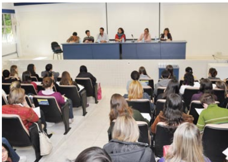
Auditório do Centro Sócio-Econômico da UFSC teve lotação máxima durante o último dia evento

Já no dia 13 foi realizada uma Mesa Redonda com o Tema O cenário contemporâneo dos movimentos sociais. O evento lotou o auditório do Centro Social-Econômico.