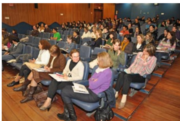
Auditório da UFSC no primeiro dia de evento

Cerca de 400 estudantes e profissionais participaram dos eventos realizados na Semana de Serviço Social, que teve como objetivos comemorar o dia do Assistente Social e debater o temário Nacional proposto pelo Conjunto CFESS/CRESS: “Trabalho com Direitos, Pelo Fim das Desigualdades”, subsidiar o debate acerca da realidade social na contemporaneidade e possibilitar a socialização das produções dos professores, estudantes e profissionais.